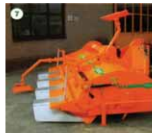
管理作業での畦の崩れを防止

その他:培土形成延長ユニット、マーカ、3スピードギヤボックス、ゴムトップカバーなど