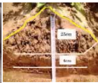
普通ロータリー&慣行培土