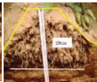
パワーロータリー&ヒラーで培土

トップカバーは厚さ6ミリ! 石の当たりやすいカバーは分厚くしました 専門メーカーならではの配慮です