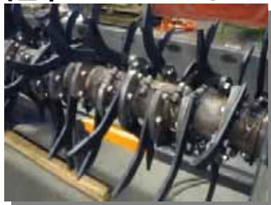
※写真は石礫地帯用ヘビーフックタイン