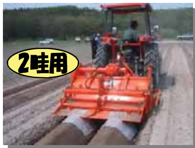
※培土形成板延長ユニット(オプション)を取り付けて作業。内側には樹脂版を取り付けています。