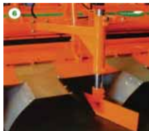
傾斜地での流れ止め