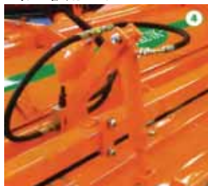
培土板の圧力を一定に保持